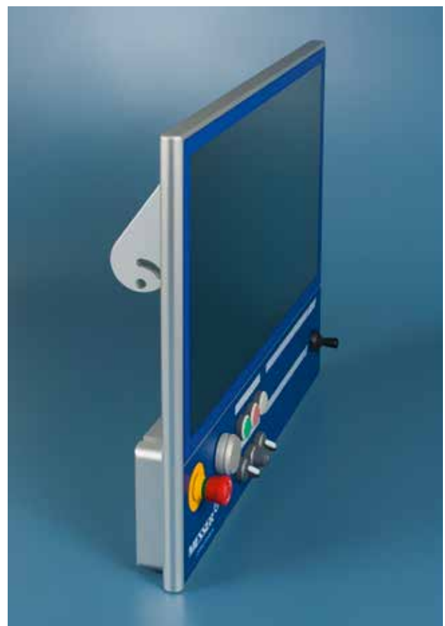
Verstärkte Schalter und Industrie-Touchscreen