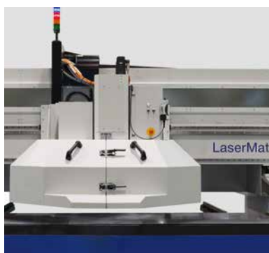
Mitfahrende Laserschutzhaube und Lichtschranken erlauben direkte Kranbeladung sowie Be- und Entladung während des Schneidbetriebs