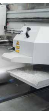
Spezifische Sonder- B. Fasenschneiden