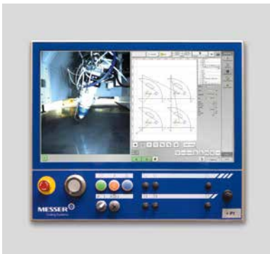
Die neue Steuerung Global Control mit 24"-Touchscreen Monitor bietet viel Platz, eine klare Bedienung und ist bei Bedarf flexibel konfigurierbar