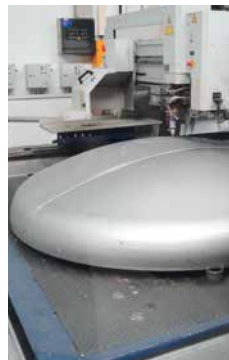
Auf Anfrage sind kundenspezifische Bearbeitungen möglich: z. B. an einem Klöpperboden