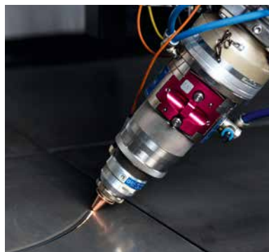
Der endlos drehbare Fasenkopf mit magnetischem Havarieschutz ermöglicht Fasenschnitte bis 45°