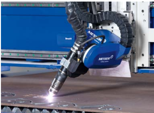
Plasma-Schneidkopf Bevel-R für Fasenschnitte mit hoher Flexibilität.