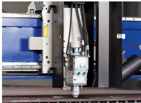
Wirtschaftliches Schneiden mit innovativem Faserlaser.